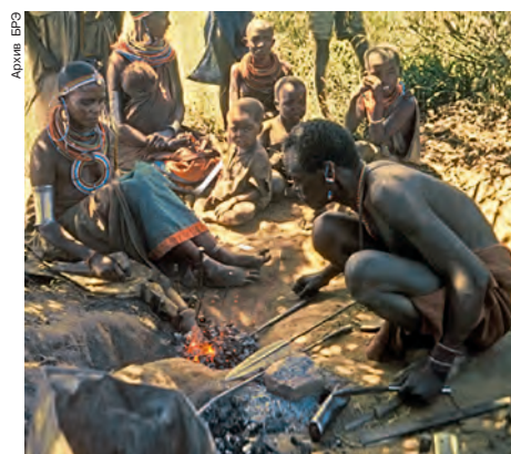
Изготовление железных наконечников у самбуру (Кения).

В традиц. культурах выплавка и обработка Ж., как одни из самых сложных технологич. процессов, требующих высокой степени специализации, воспринимались как сверхъестеств. способностей. Металлурги и кузнецы занимали изолированное положение в обществе, они могли выполнять функции жрецов, знахарей, проводить обрезание, иногда их выде-